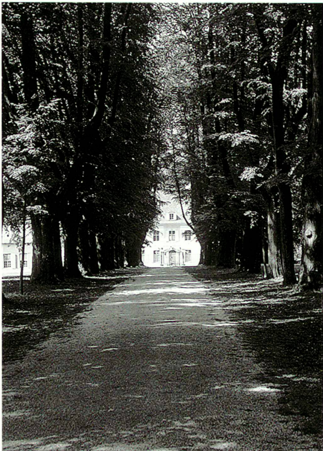
Barocke Lindenallee im Garten Ebenrain, 1997.

Toute propositions de documents sont bienvenues. Prière de contacter Madame Milena Matteini à l'adresse: Piazza Scuole Pie 7/10a, I-16123 Genova, téléphone/fax 0039-10-247 07 15.