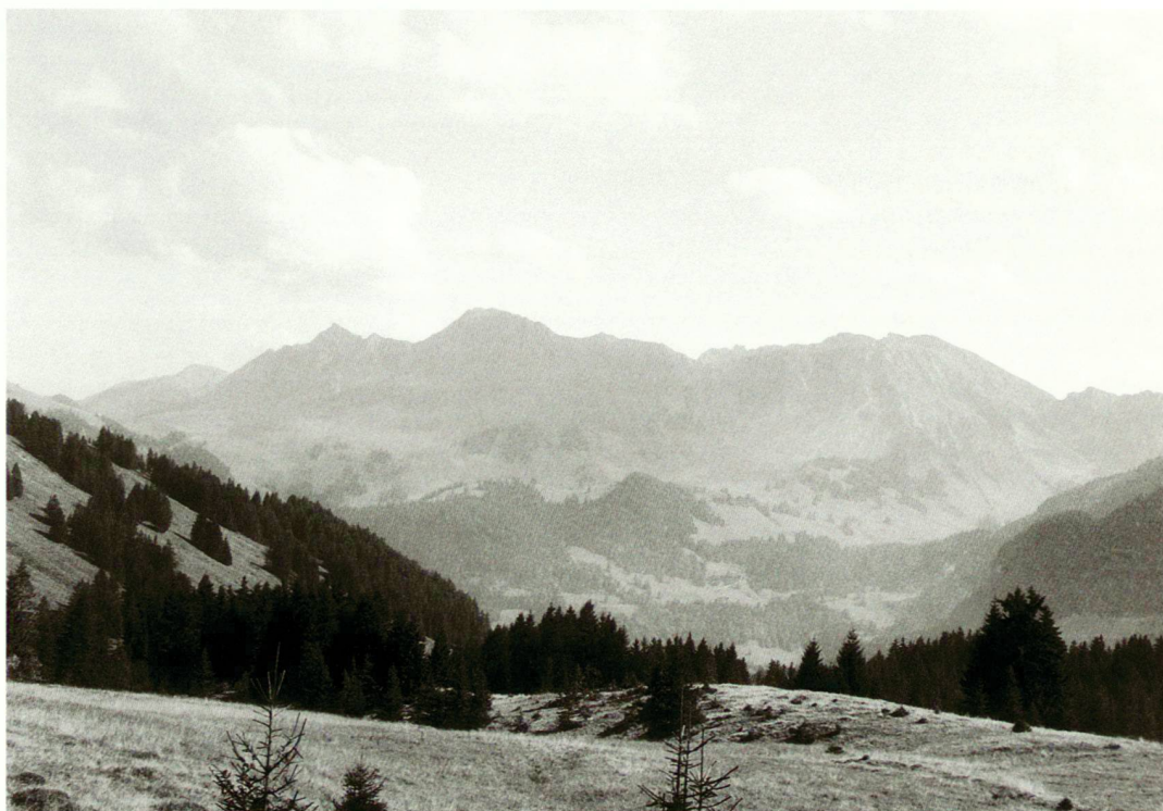
Das sanft abfallende Gelände der Alp Spielmannda. Im Hintergrund: Kaiseregg (2'185 m).

Die Stiftung Natur & Wirtschaft soll in erster Linie Unternehmen mit geeigneten Arealen zum Mitmachen anregen und Betriebe bei Konzeption und Durchführung einer naturnahen Gestaltung fachlich unterstützen. Damit bleibt der Aufwand der Firmen auf einem tiefen Niveau. Darüber hinaus plant die Stiftung: Gemeinden einzubinden; spezielle Pilotprojekte auszulösen; die Weiterbildung von Hauswarten, Gärtnern usw. zu fördern; ein Qualitätslabel zu schaffen, welches beteiligte Firmen in der Öffentlichkeitsarbeit einsetzen können und die Öffentlichkeit auf naturnahe Umgebungsgestaltung zu sensibilisieren und darüber zu informieren. Folgende Firmenareale wurden bisher zertifiziert: BLT – Baselland Transport AG, Rodersdorf; Walter Siefert AG, Pratteln; Ciba Spezia-