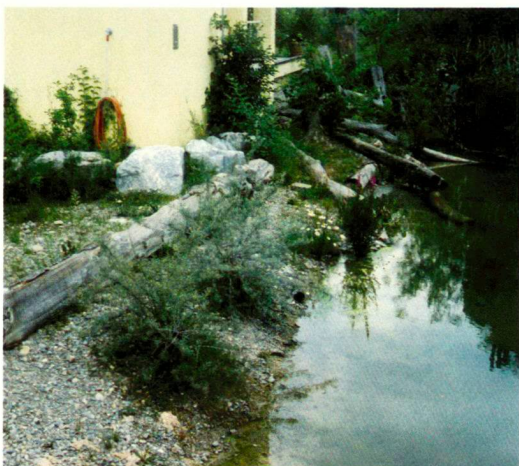
Unterer Teich, 1997: eingewachsene Situation

Comment enchaîner après la destruction de milieux de grande valeur écologique – peut-on remplacer des sites naturels? Un exemple à Zurich, où l'eau joue un rôle important.