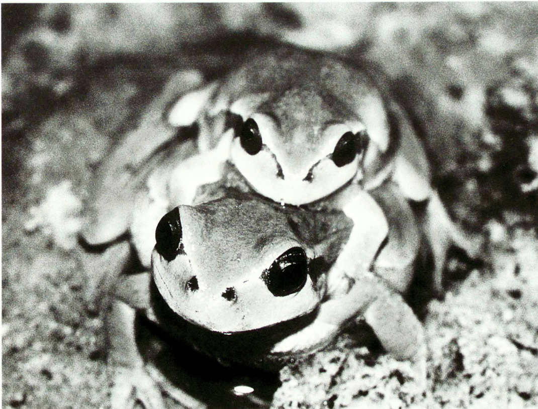
Immer noch eine Rarität: Laubfrosch-Paar

Pro Natura, Wartenbergstrasse 22, Postfach, 4020 Basel