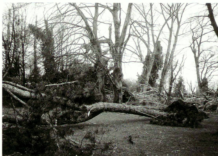
Die Parkanlagen am Zürichhorn am Tag nach dem Sturm.

Die Delegierten des SHS haben diesen Sommer an der jährlichen Versammlung einem neuen Verbandsleitbild zugestimmt. Es ist die schriftliche Formulierung der Ideen, die hinter dem SHS stecken. Das Leitbild legt dar, wie sich der SHS selber versteht und was er will. Das Leitbild dient als Basis für die Erarbeitung der mittelfristigen Zielsetzungen und des jährlichen Tätigkeitsprogrammes. Der Text gliedert sich in neun Abschnitte. Zu je einem Stichwort steht eine Kernaussage und eine Erläuterung oder Präzisierung. Im Zentrum stehen die Aussagen, dass sich der SHS nicht nur für die Erhaltung qualitätvoller Bauwerke einsetzt, sondern auch für eine qualitativ hochstehende Weiterentwicklung unserer gebauten Umwelt. Der Heimatschutz sieht sich zudem in einer Brückenfunktion zwischen Fachleuten und der breiten Öffentlichkeit. Weiter wird die Verantwortung der Politik angesprochen und der sparsame Umgang mit Ressourcen gefordert. Das Leitbild richtet sich an alle, die an den Grundideen des SHS interessiert sind: aktive und passive Mitglieder, Dritte, die mit