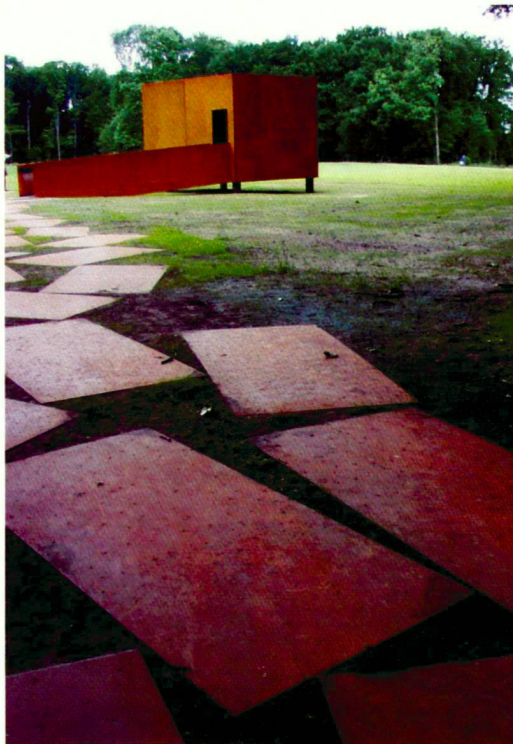
Plattenweg zum Pavillon des Sehens

Mittig durch das Landschaftsfenster zieht sich – einem Rückgrat gleich – der landmesserartig mit Stahlstäben abstrakt markierte Verlauf des ehemaligen Germanenwalls. Dicht gesetzt sind die Stäbe dort, wo Gewissheit besteht über den tatsächlichen Verlauf, offen – sozusagen provisorisch markiert – die Bereiche, wo erst Vermutungen vorliegen.