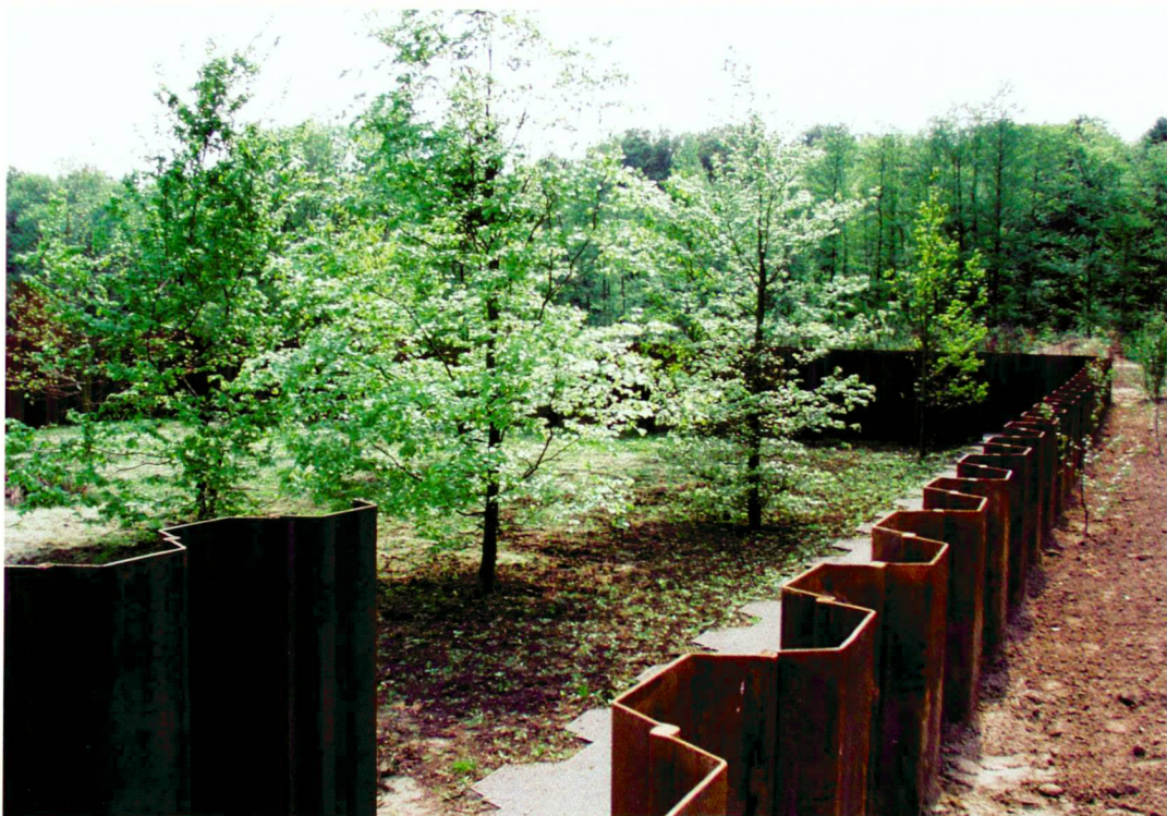
«Skizze» der Landschaft im Jahre 9

En musardant à travers le lieu, on rencontre trois cubes d'acier détachés du sol; à travers leur revêtement de couleur rouille, ils sont clairement identifiables comme faisant partie des interventions, au même titre que le musée, le marquage du remblai de fortification et la voie romaine. Y pénétrer, signifie aussi quitter la réalité vécue du lieu; quitter la façon de se déplacer des Romains, se retrouver du côté des Germains, guetter l'ennemi, entendre, sentir, comprendre. Dans cet espace, la réalité des sensations devrait être comprimée et aller à l'essentiel.