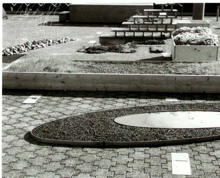
Studentische Projekte an der Professur für Landschaftsarchitektur, ETH Zürich