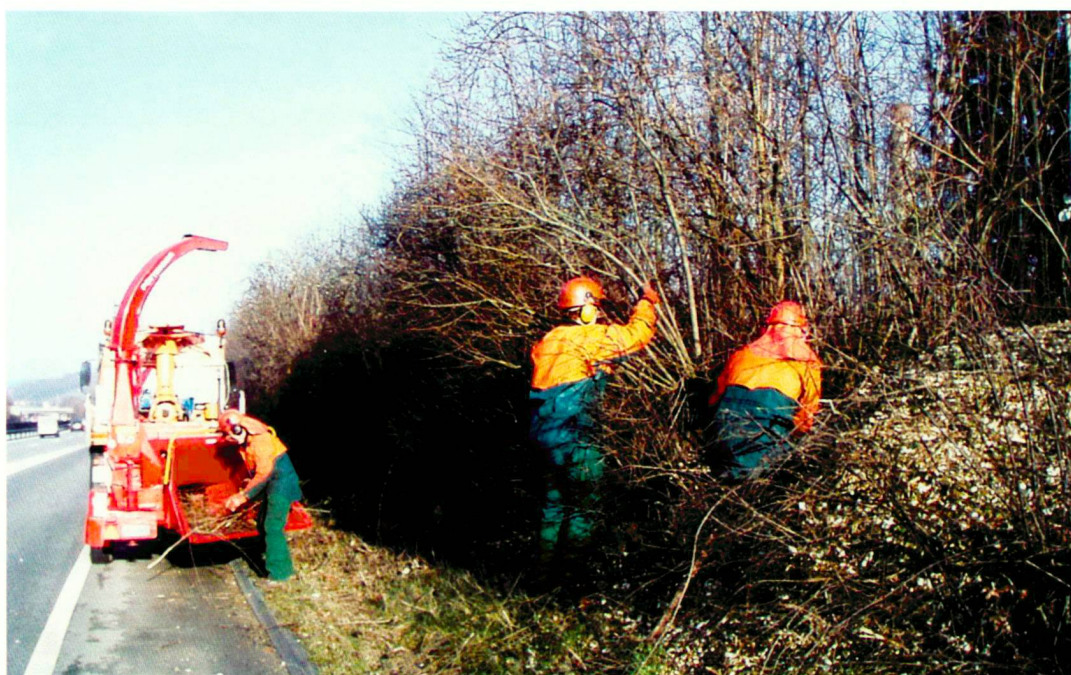
Pflegeequipe beim Gehölzschnitt

La planification des délais est un outil central de la gestion des espaces verts. À l'aide de la planification des délais, les moyens nécessaires à l'exploita-