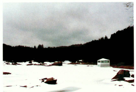
Ansicht im Winter

Olgiati: Ce lieu est extraordinaire. Le paysage a ici une forte capacité d'évocation, un aspect très important pour mon projet. Mon objectif est de renforcer d'avantage encore ce paysage à travers le projet. La maison au bord du lac et dans la forêt forme une constellation mythique qui marque fortement l'esprit. Le bâtiment est en dialogue avec la nature et ses changements. En été il ressemble à une barque et en hiver à un élément de forteresse.