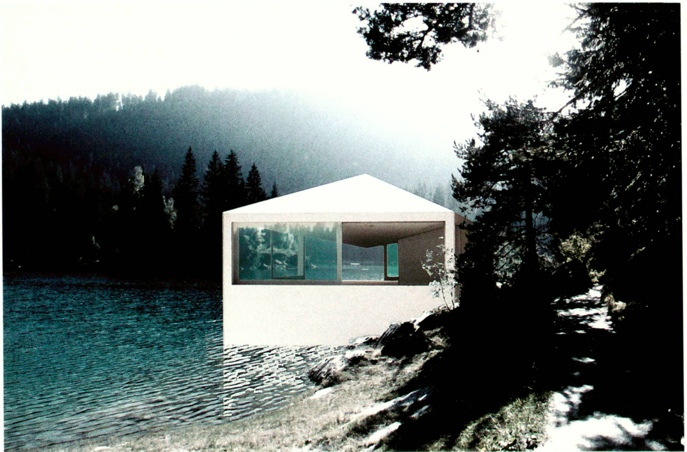
Ansicht im Sommer