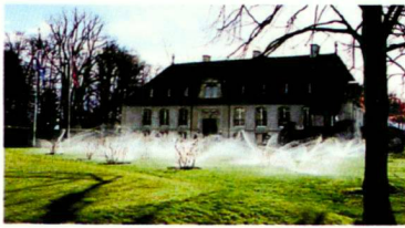
Golf de Genève, Februar 2000