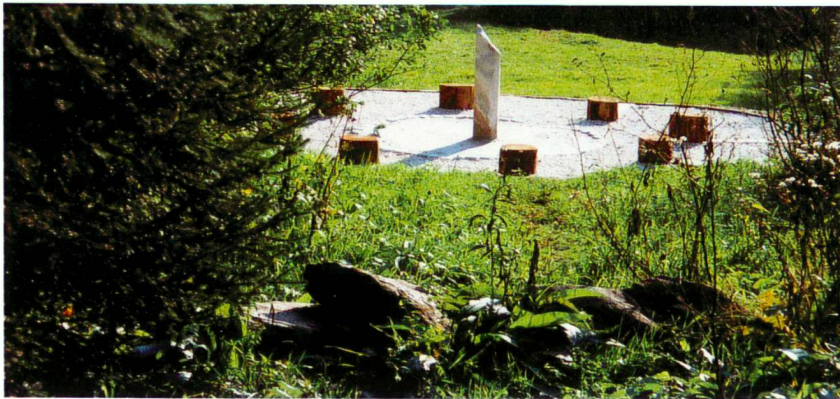
«Meditation point», Veronik Menanteau, 2001