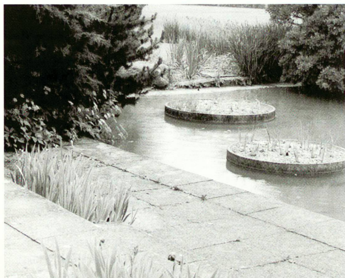
Belvoirpark, Zürich, Umgestaltungen der G 59, Foto von G. Dannenberger

Informationen: HSR, Assistenz NDS-L, Telefon 055-222 49 01 oder assistenz.nds-l@hsr.ch , www.l.hsr.ch , Weiterbildung