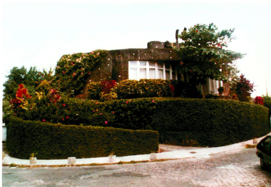
Haus des Chame-Chame in Salvador de Bahia (1958)

L'architecture de Lina Bo Bardi s'imprègne du paysage voluptueux brésilien.