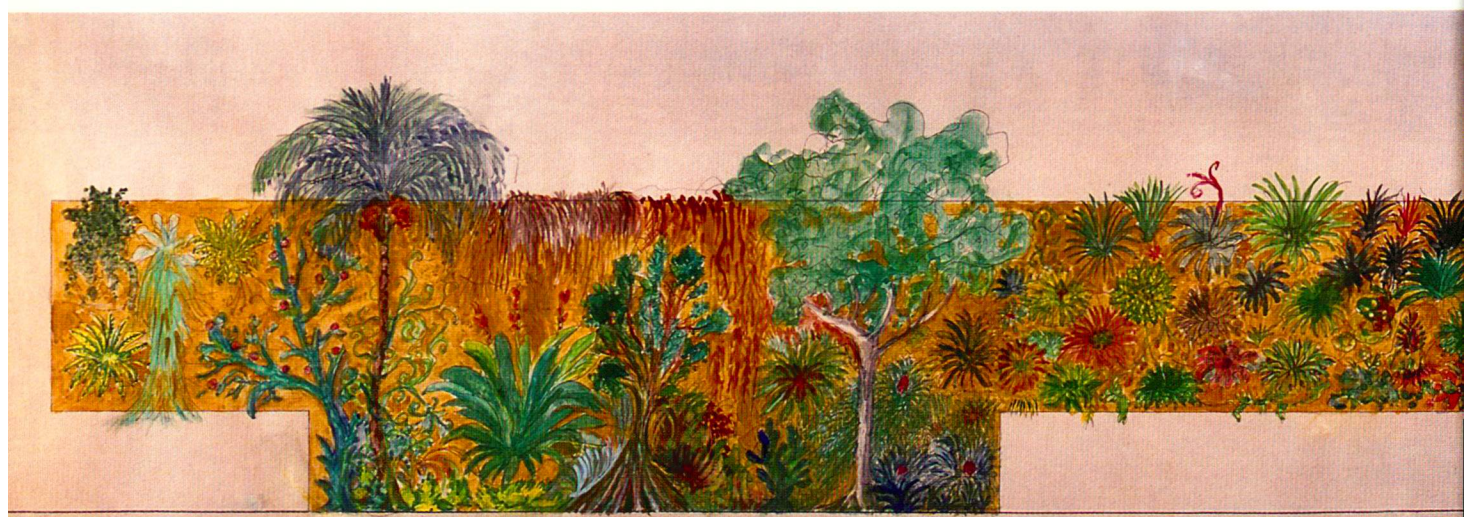
ELEVACÃO PAREDE JARDIM VERTICAL

A chaque projet, l'élément vert apparaît dans les dessins dès ses premiers croquis: arbres traversant littéralement ses bâtiments, mousse et fleurs poussant sur les murs, structures mimétiques ou même prenant des formes végétales (escaliers-fleurs, colonnes-arbres, etc.) dans une claire référence au baroque et à l'imaginaire surréel ou onirique de Gaudí. Ici, les éléments naturels sont eux-mêmes matériaux de l'architecture; ils supportent, cohabitent, dialoguent ou même camouflent le bâti. L'objet construit ne s'impose pas face à la nature et à l'existant, mais l'écoute et en apprend les règles pour son propre fonctionnement. C'est une attitude contraire à celle du colonisateur, qui s'installe de force sans prendre en compte le passé. Et cela ne suppose pas une passivité nostalgique envers le passé. Le passé est, pour Lina Bo, synonyme de mémoire – individuelle ou collective – et la mémoire est le sentiment humain par excel-