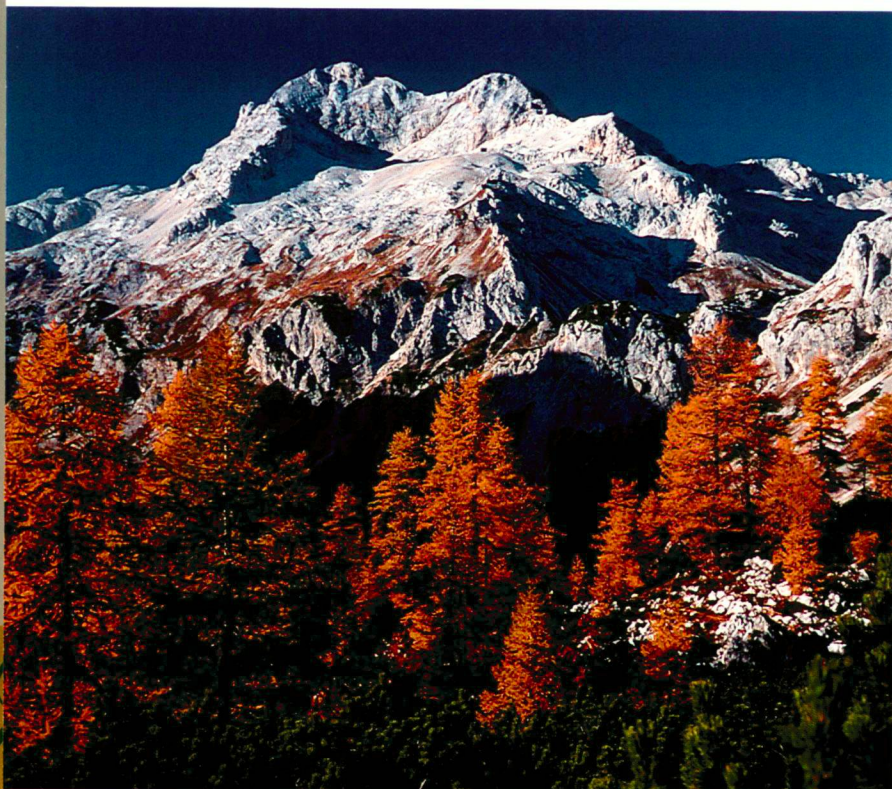
Triglav (2864 m), Südost-Seite (Nationalpark Triglav, Slowenien)

wurde seit den 60er-Jahren geschaffen: Triglav (SI) 1961, La Vanoise (F) 1963, Les Ecrins (F) 1973, Berchtesgaden (D) 1978, Mercantour (F) 1979. Diese Welle von Nationalparkgründungen ist oft gekennzeichnet durch Nutzungskonflikte in den entsprechenden Gebieten, besonders in Bezug auf den Wintersport. Es ist also nicht erstaunlich, dass einige der in dieser Epoche entstandenen Nationalparks als «Kompensationsflächen» betrachtet werden, angesichts einer touristischen Entwicklung, die starken Druck auf die Umwelt ausübt.