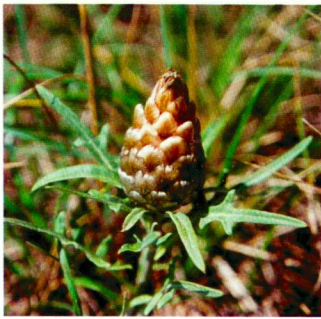
Leuzea conifera