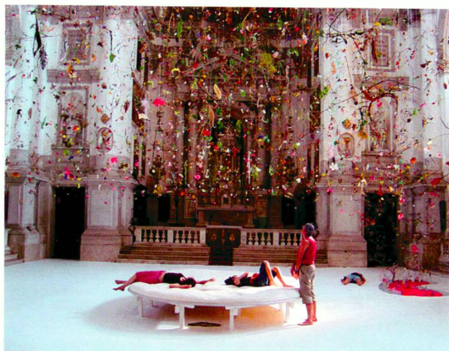
Der «Fallende Garten», präsentiert an der 50. Biennale in Venedig, von Gerda Steiner und Jürg Lenzlinger