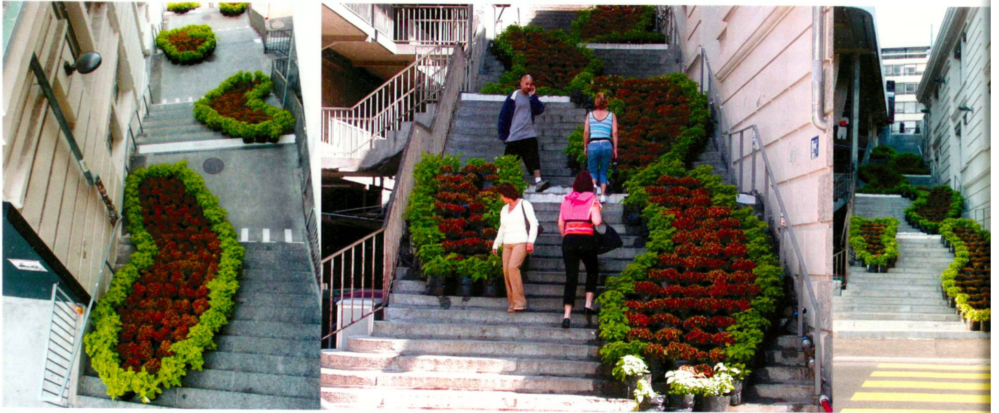
Bancs publics – Hüsler/Amphoux

Contact: Association Jardin Urbain, téléphone 021-691 37 53, www.lausannejardins.ch , les jardins sont ouverts du 19 juin au 17 octobre