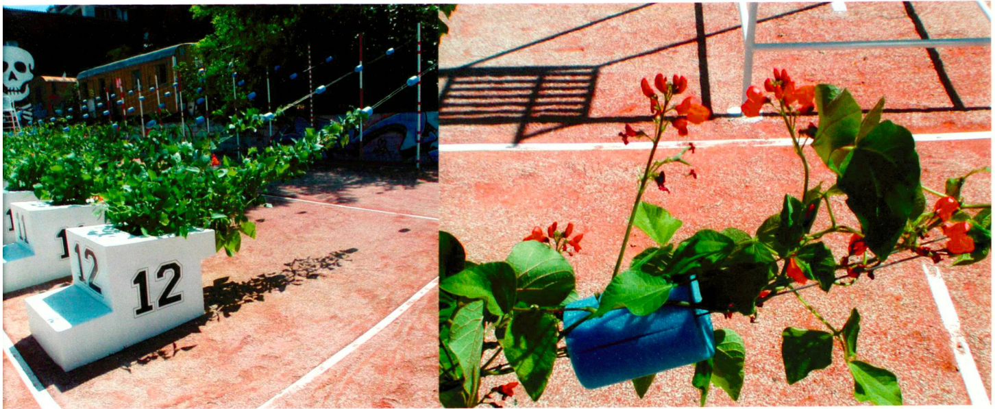
Les coureuses – Squash cake bureau