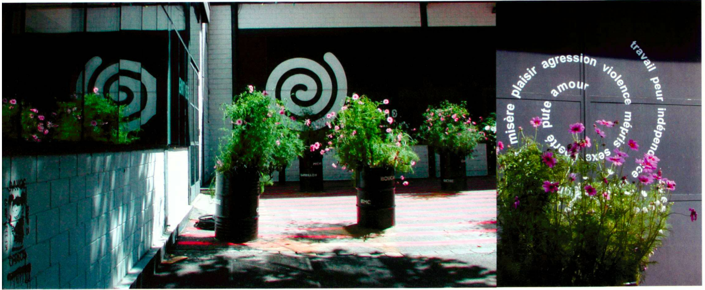
Fleurs de pavé – L'atelier du paysage/Le Baron