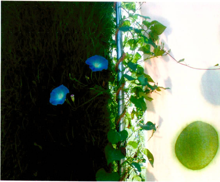
Dans de beaux draps – HES Lullier