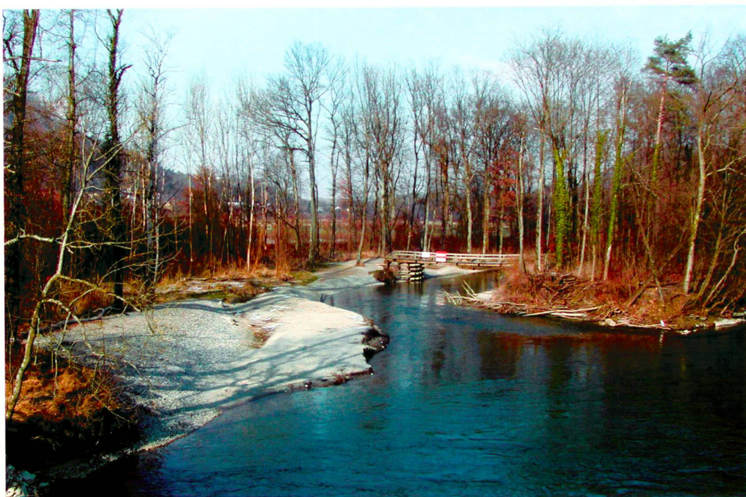
Renaturierter Ausschachen, Brugg: neue Pfade und Buchten unter Clematis-Lianen und knorrigen Pappeln.

Les quatre thèses développées par la suite devraient susciter une discussion sur la meilleure intégration des espaces naturels de détente dans la phase de planification. C'est également un plaidoyer en fa-