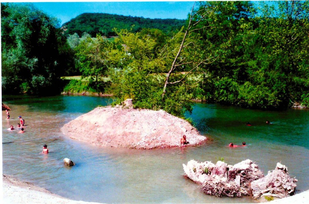
Der renaturierte Aarearm Strängli bei Windisch: Natur zeigen und Spiel zulassen.

Le Strängli, bras revitalisé de l'Aar, près de Windisch: montrer la nature et permettre le jeu.