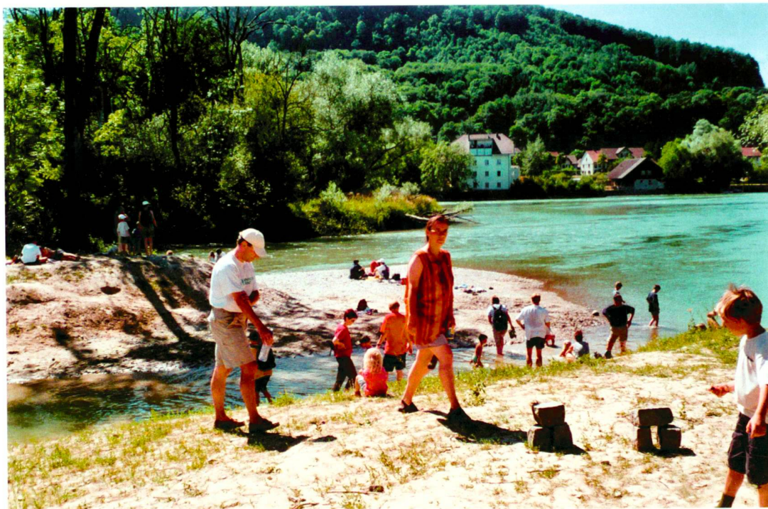
Einweihungsfest 2003 am Limmatspitz, Gebenstorf, beim vergänglichen Natur-Kultur-Kunstwerk «Der Turm der drei Fräulein» von Roger Seeberger.

Fête d'inauguration 2003 au Limmatspitz, Gebenstorf, autour de l'œuvre éphémère nature-culture-art «Der Turm der drei Fräulein» (La tour des trois Demoiselles) de Roger Seeberger.