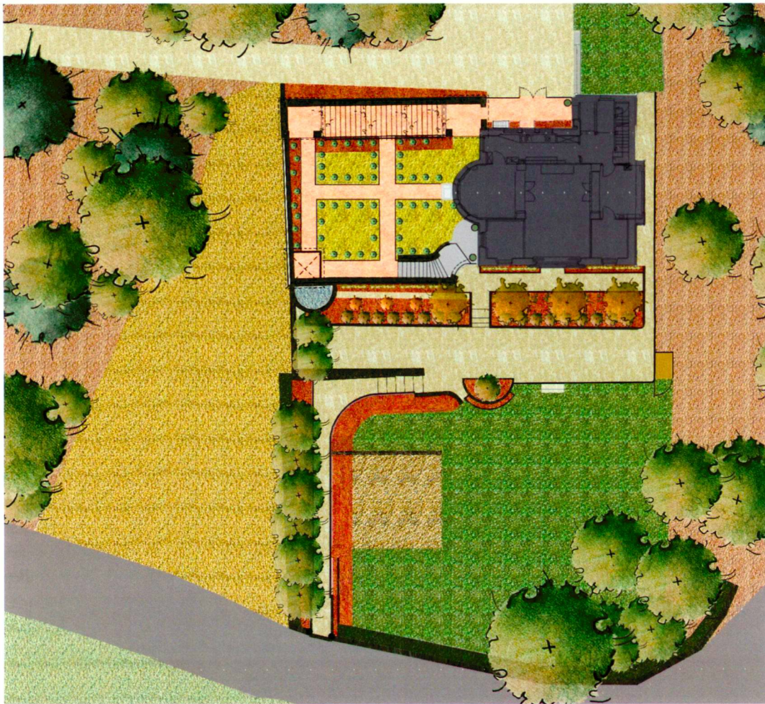
Plan des Rekonstruktionskonzepts 2004.