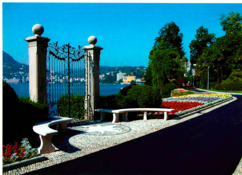
Detail des Eingangsportals vor der Sanierung (oben) und 2004 (unten).