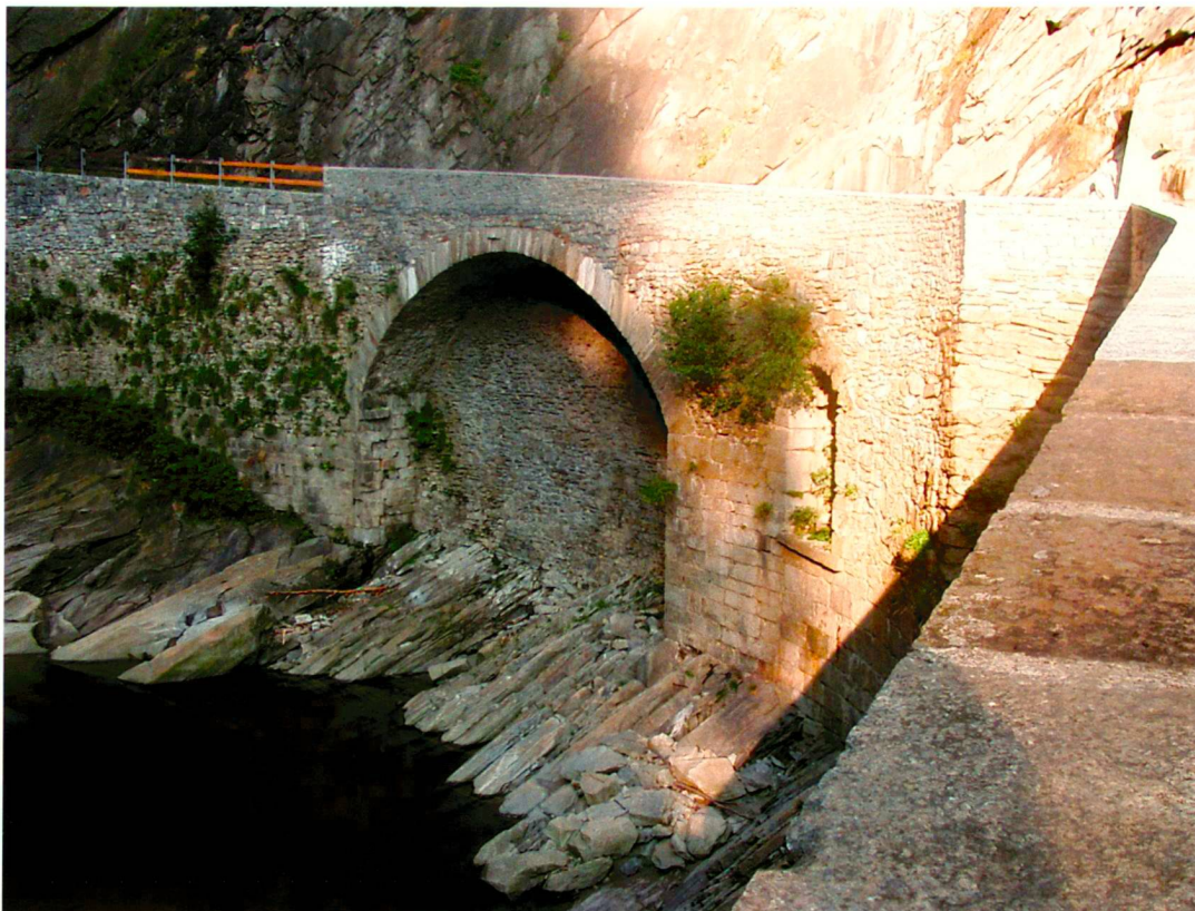
Restauriertes Tonnengewölbe mit originalem Mauerwerk und einer neuen Brüstung.

de parapets routiers, en partie effondrés, ainsi que du pont en arc datant de 1820. De nouveaux chemins furent réalisés à l'entrée et à la sortie de la gorge. Les pierres nécessaires pouvaient être extraites dans la gorge même. La Fédération, le canton du Tessin, Patrimoine suisse, d'autres institu-