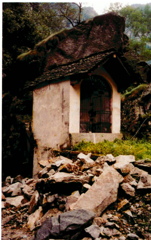
Wegkapelle am oberen Eingang zur Schlucht, vor der Restauration der Strasse.

Aux alentours de 1820, le jeune canton fit élargir le chemin, afin de le rendre carrossable pour les chariots et les diligences. A partir de ce mo-