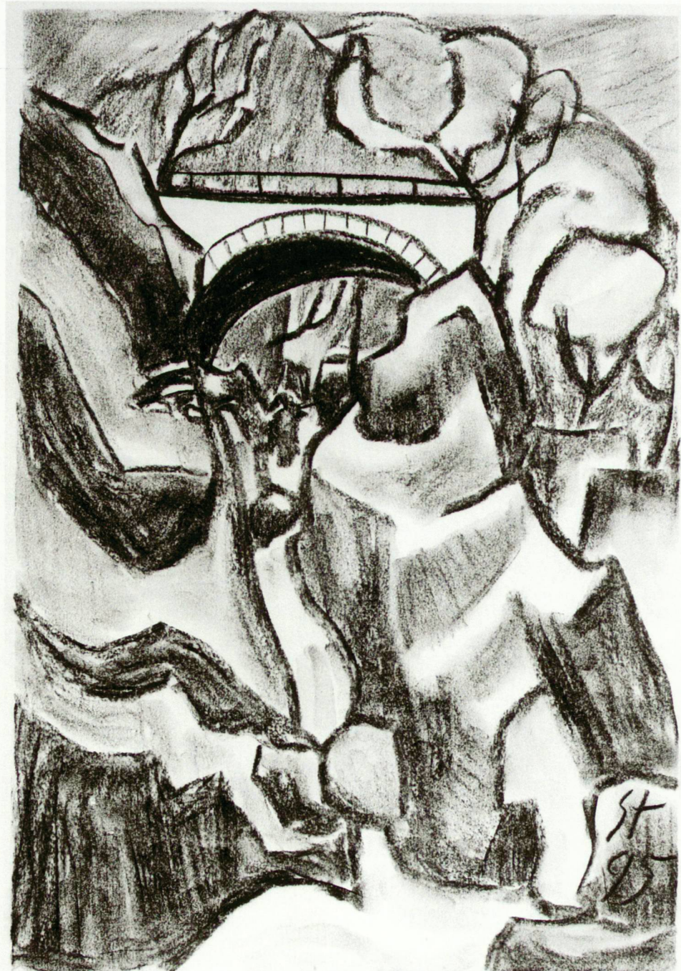
Brücke am oberen Eingang zur Piottinoschlucht.

L'association «Pro Media Leventina» a réalisé entre 1993 et 2003 la restauration de la route historique qui passe à travers la gorge de Piottino façonnée par la rivière tessinoise. C'est une contribution importante au tourisme pédestre dans une vallée de montagne riche en histoire et en beauté naturelle.