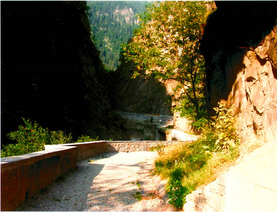
Der restaurierte Weg durch die Piottino-Schlucht.

Le chemin restauré à travers la gorge de Piottino.