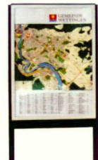
Infostelen, Infoträger, Vitrinen, Leuchtkasten

Public Elements - Produkte für den öffentlichen Raum.