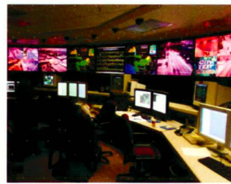
Bilder der Ausstellung / Images de l'exposition: «Loop Feedback Loop: The Big Picture of Traffic Control in Los Angeles». Center for Land Use Interpretation, California 2004, www.clui.org