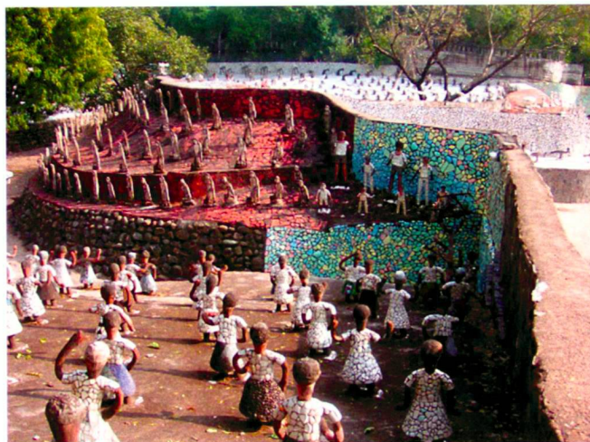
«Le Royaume de Nek Chand» à Chandigarh.

Landschaft quo vadis? In Sorge um die Entwicklung unserer Landschaften trafen sich am Forschungskolloquium Gestalt Landschaft Schweiz am 18. Mai in Bern erstmals Fachleute verschiedener Disziplinen aus Praxis, Wissenschaft und Verwaltung zur Diskussion über Forschungsstand und Perspektiven. Im Zentrum der Betrachtung stand die ästhetische und gestalterische Qualität der Landschaft. Dieser wird bis heute zu wenig Beachtung geschenkt, obschon sie für die Lebensqualität und das