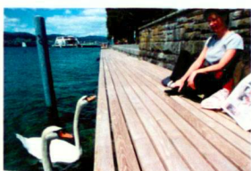
Die Seeuferanlage Meilen von Raderschall Landschaftsarchitekten bietet ein identitätsstiftendes Gesamtbild und zahlreiche nutzerfreundliche Details.