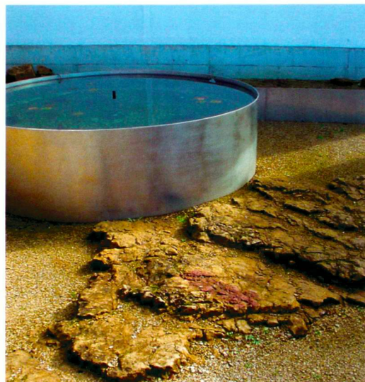
Seerosenbecken aus Chromstahl auf dem anstehenden Fels.

Planung: Fahrni und Breitenfeld, 2002–2003 Ausführung: 2003 Baukosten inkl. Honorar CHF 150 000.– Mitarbeit: P. Gysin und S. Martin