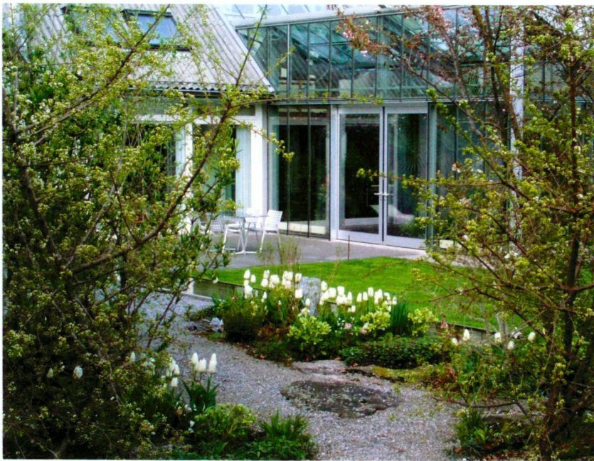
Weisser Garten mit Wohnhaus und Wintergarten.