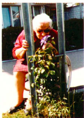
Ein lebendiges, sicheres Umfeld motiviert zum Aufenthalt im Freien.

Die Studie von Peter Kriesi zur Situation und möglichen Umgestaltung von Therapeutischen Aussenräumen für Autisten ist ausgesprochen kenntnisreich in einem wenig bekannten Bereich der therapeutischen Arbeit. Auch er erbrachte durch Befragung verschiedener Institutionen den Nachweis, dass Therapieräume gewünscht werden. Er entwickelte eine Übersicht über Grundmodule, die auf das jeweilige Krankheitsbild und die Therapie abgestimmt sind, und empfiehlt ein differenziertes Konzept von Räumen, in denen sehr kontrolliert die Reizmenge zunimmt (HSR, Abteilung Landschaftsarchitektur).