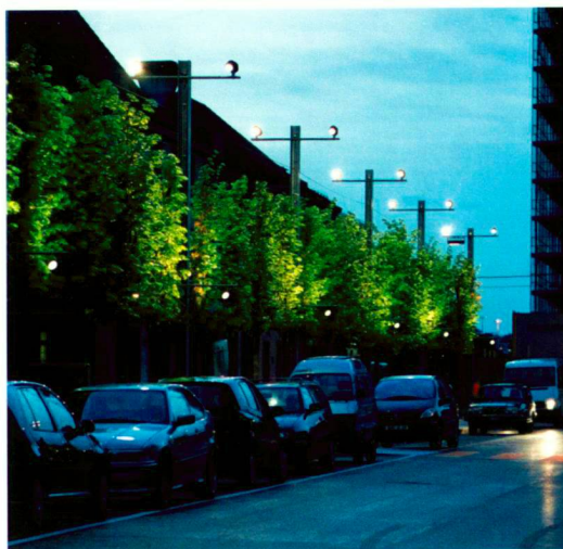
Nächtliche Inszenierung der Blätterwände.

Der Espace de l'Europe wurde zur Eröffnung der Expo.02 fertig gestellt. Es folgten andere Aufträge, die ebenfalls im Dialog mit der urbanen Landschaft stehen: vor dem «Turm» des Bundesamtes für Statistik, in der Verlängerung der Schulen für Verwaltung und für Musik, schliesslich entlang des im Bau befindlichen Gebäudes Ecoparc. Auf diese Weise erhielt der gesamte Bereich um den Bahnhof von Neuenburg als «Pol der strategischen Entwicklung» eine zusammenhängende Gestaltung. Eine seltene Gelegenheit für ein Landschaftsarchitekturbüro, durch mehrere aufeinander folgende Aufträge am Bau eines grösseren Stadtteils teilzunehmen.