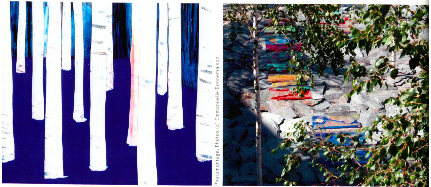
Photomontage, Photos (2) Emmanuelle Bonnemaïson

Der Innenhof des neuen Schulzentrums in Marcellin bei Morges VD setzt die weissen Stämme und lockere Belaubung eines Birkenhains in Szene.