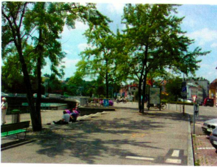
Stadtgärtnerei Schaffhausen (3)