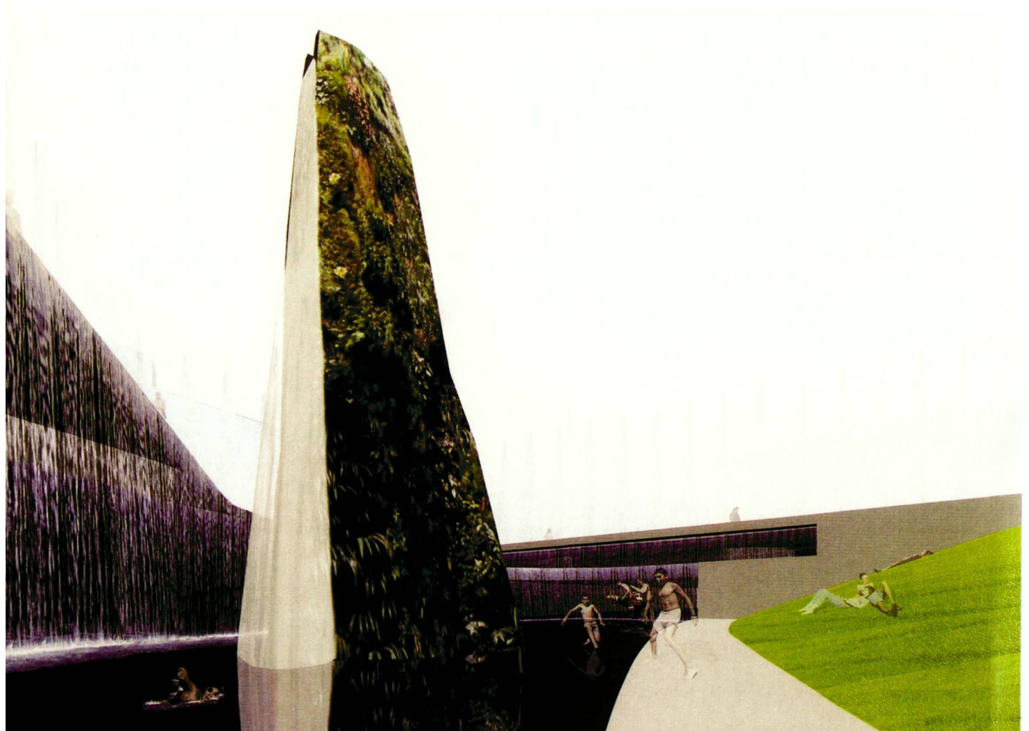
The «Prix de Rome» 2006 was awarded to «Water Moss Rocks», a project from Ronald Rietveld.

«Water Moss Rocks». This project is a response to a new challenge for Amsterdam: the increasing volumes of precipitation as a result of the changing climate. Already now, the city is unable to deal adequately with the rainwater. Overflowing sewers pollute Amsterdam's famous canals. The city is developing plans for 60 underground water storage facilities. Rietveld's project focuses on the chances of increasing rainfall. He proposes to avoid canal water pollution and mixing of clean rainwater with sewer water by collecting clean rainwater for sustainable re-use. «Water Moss Rocks» proposes to use the «Mr. Visserplein», an existing underground network, for storage of rainwater. After realization of the project, every year 72 million litres of fresh rainwater will flow from nearby squares and roofs into the Mr.