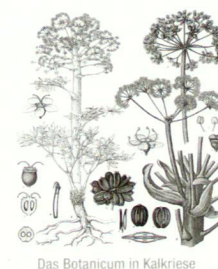
Das Botanicum in Kalkriese