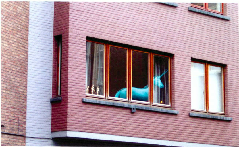
Ulrich Berding (2)