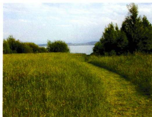
Liegewiesen, Strände und Naturzonen zwischen St-Blaise und Hauterive.

Prairies, plages et zones naturelles entre St-Blaise et Hauterive.