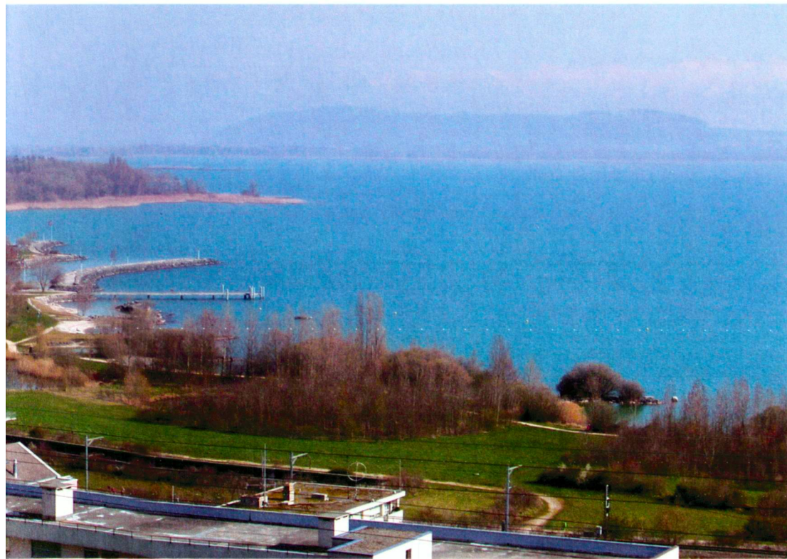
Neugestaltung des Ufers des Neuenburgersees zwischen Hauterive und St-Blaise.

Réaménagement de la rive du lac de Neuchâtel entre Hauterive et St-Blaise.