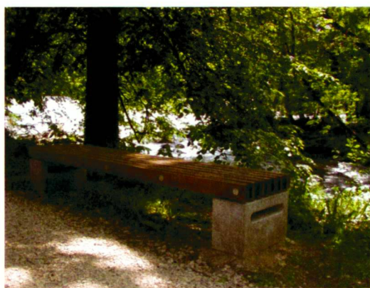
Der renaturierte Bach Pré-Novel (links), Erholungs- und Ausgleichs- zone Pervou (rechts).

Revitalisation du ruisseau de Pré-Novel (à gauche), Zone de détente et de compensation du Pervou (à droite).