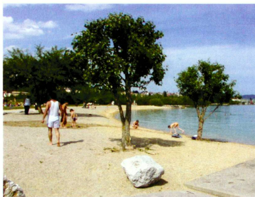
Marie-Hélène Giraud (4)

Die interdisziplinäre Herangehensweise, welche die Konfrontation unterschiedlicher Planungsgesichtspunkte ermöglichte, die ökologi-