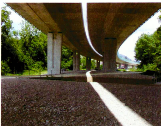
Anlage unter dem Viadukt Chanélaz.

Le deuxième concerne les plantations le long de l'autoroute. Une végétation basse de type buis-