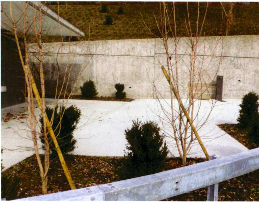
Zugangsort zum Toilettenhäuschen.