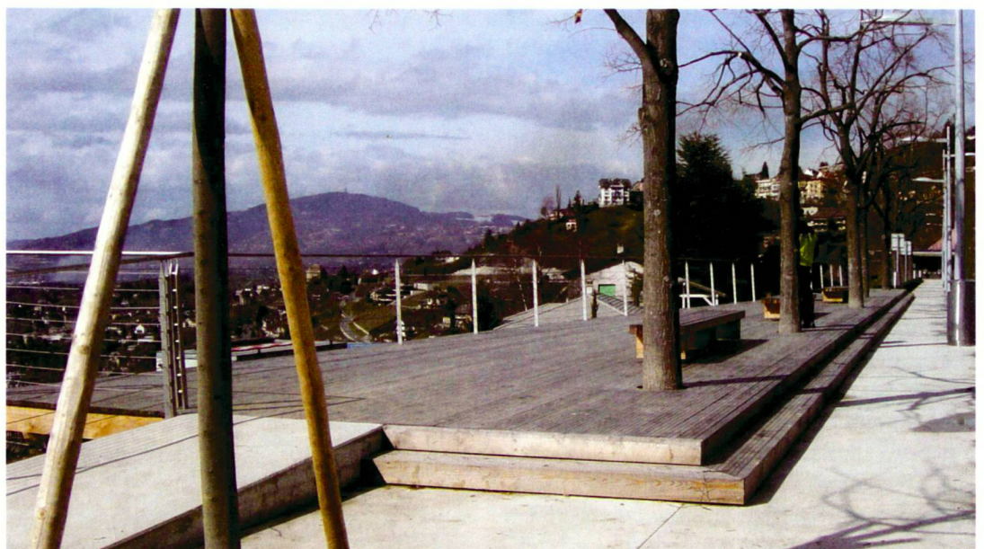
Le belvédère intègre l'alignement d'arbres existants.