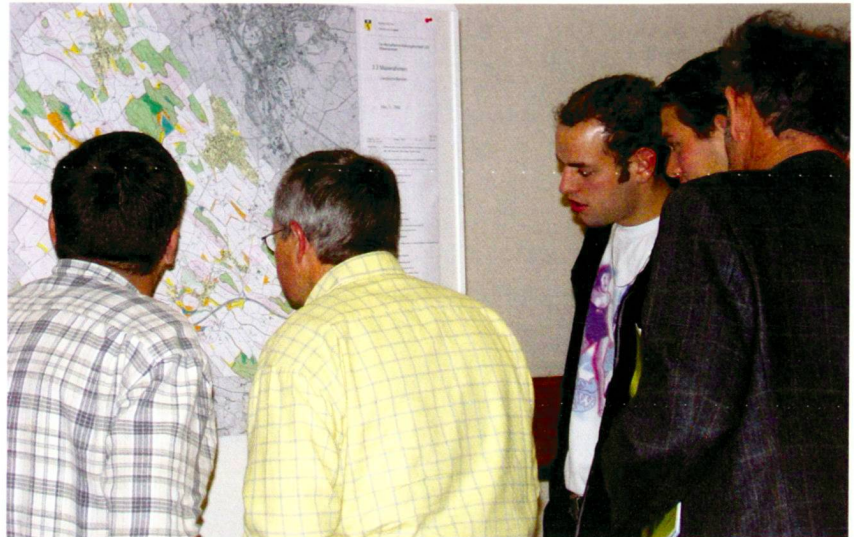
Fachstelle Landschaftsentwicklung HSR

Angesichts einer immer stärker fortschreitenden Zersiedlung des Mittellandes, die einher geht mit einer starken Gesichts- und Identitätslosigkeit der bebauten und unbebauten Landschaft, muss die aktuelle Diskussion um den Stellenwert der Landschaft forciert werden. Die Entwicklungsperspektiven für die Gemeinden dürfen nicht nur auf attraktive Arbeitsplätze, gute Verkehrsverbindungen an die grossen Agglomerationszentren oder auf bezahlbares Bauland zielen. Um in der Standortgunst in vorderster Reihe stehen zu können, sind attraktive unverwechselbare Kulturlandschaftsräume und Erholungslandschaften ebenso wie ein attraktives innerörtliches Freiraumangebot von Plätzen und kleineren Parks wichtig für die Zufriedenheit der Bewohnerinnen und Bewohner. In den derzeitigen Immobilien-Rankings ist die Landschaft ein fester Bestandteil der Bewertung. Das zu Beginn be-