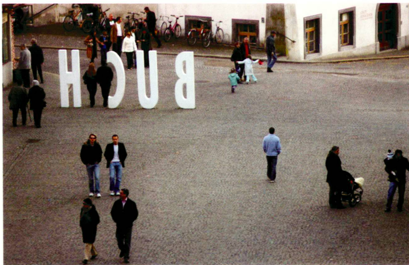
Yves Maurer (2)

Des espaces de détente près des agglomérations (en bas).