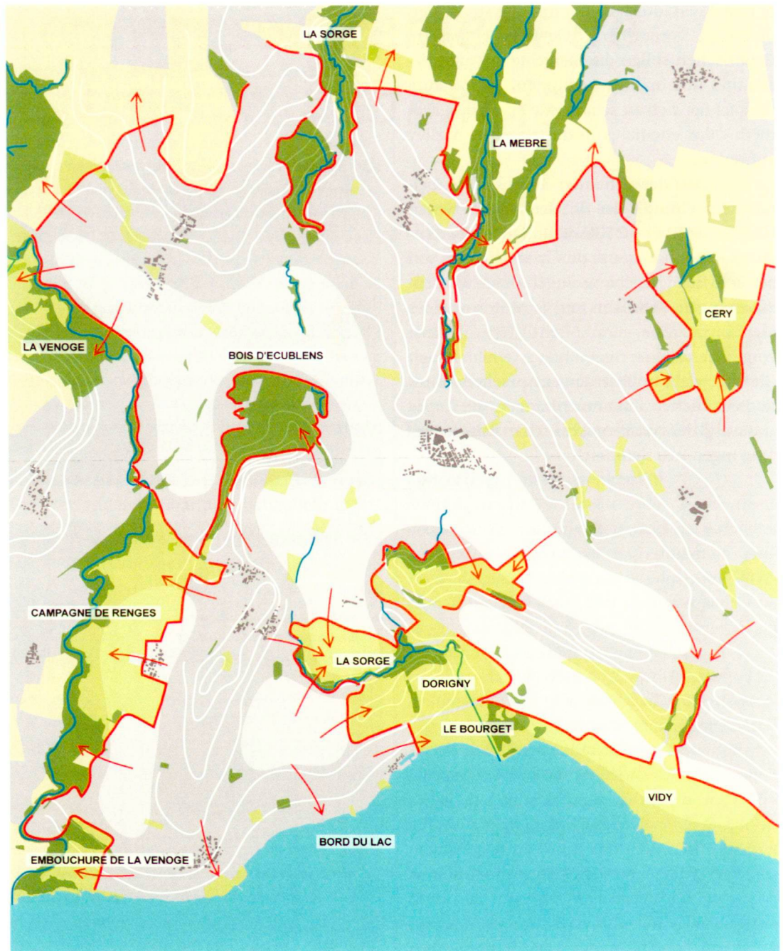
Planer: ADR (2)

«SDOL - Chantier 5 - Espaces publics et mobilité douce», ADR, Citec, Itinera.