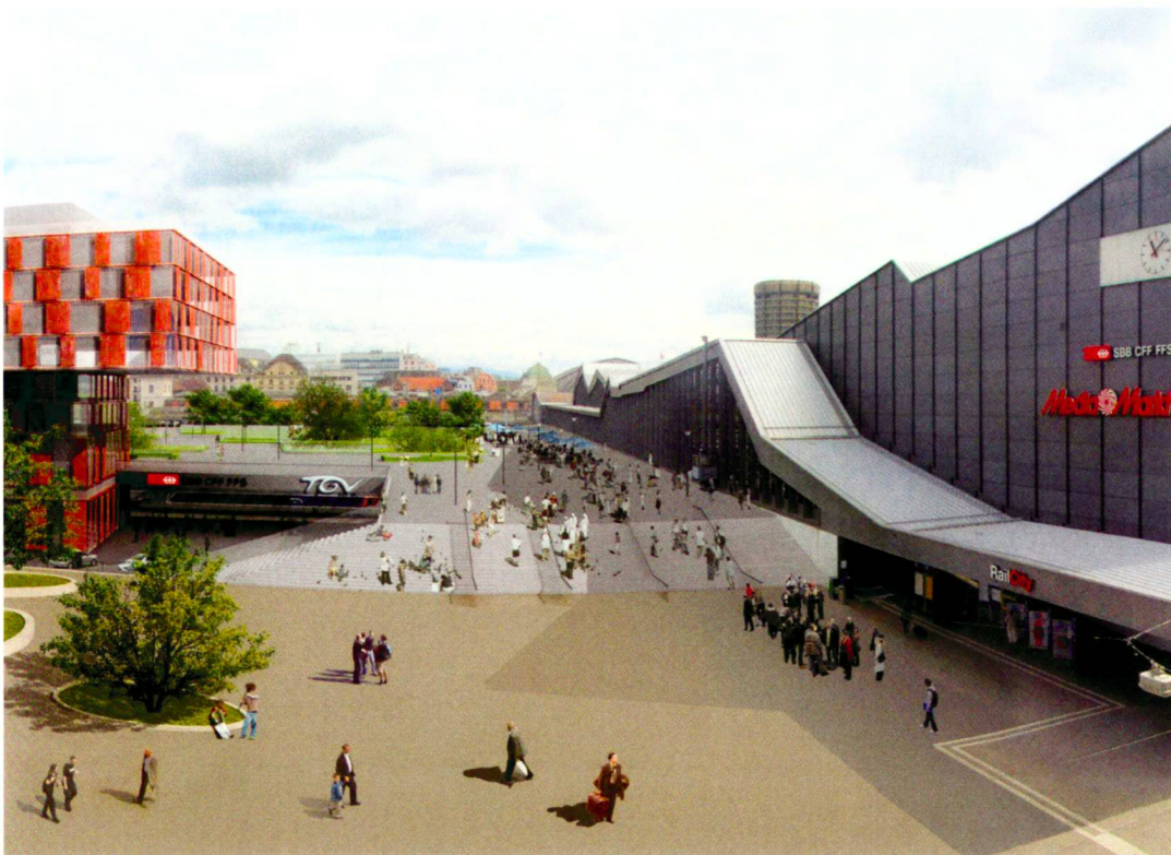
Zugang zum Park vom Quartier Gundeldingen.

Une friche ferroviaire en plein milieu de Bâle offre un potentiel de 30 000 mètres carrés de terrain à développer dans un canton-ville dont la croissance est limitée.