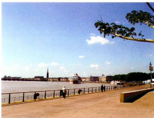
Atelier Corajoud (5)

Rive gauche de la Garonne, quais jardinés: pierres, eaux, ombres et lumières.