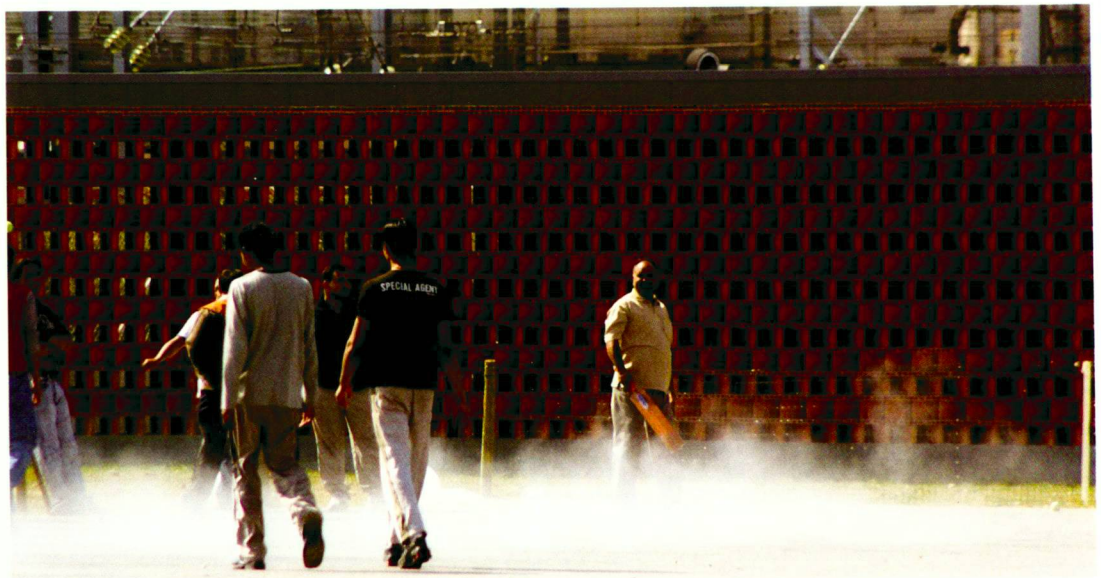
Sichtschutz Ziegelstein- mauer, Künstlerin Carmen Perrin, Genf.