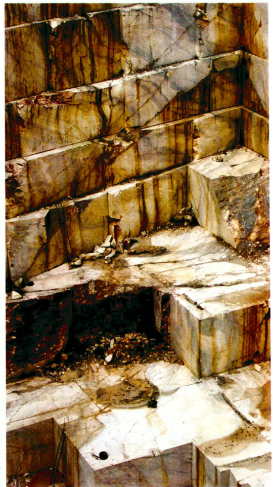
Hanspeter Burkart (4)