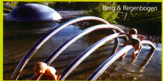
Berg & Regenbogen

Unsere Produkte Vielfalt lässt keine Wünsche offen. In eigenen Werkstätten und mit exklusiven Partnern bieten wir ein Top Sortiment für die zeitgemässe Ausstattung von öffentlichen Räumen an.