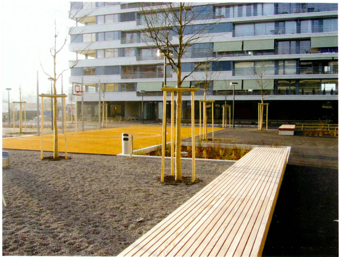
Catherina Bauer (4)

Le revêtement beige des terrains de jeu contraste avec l'enrobé gris.