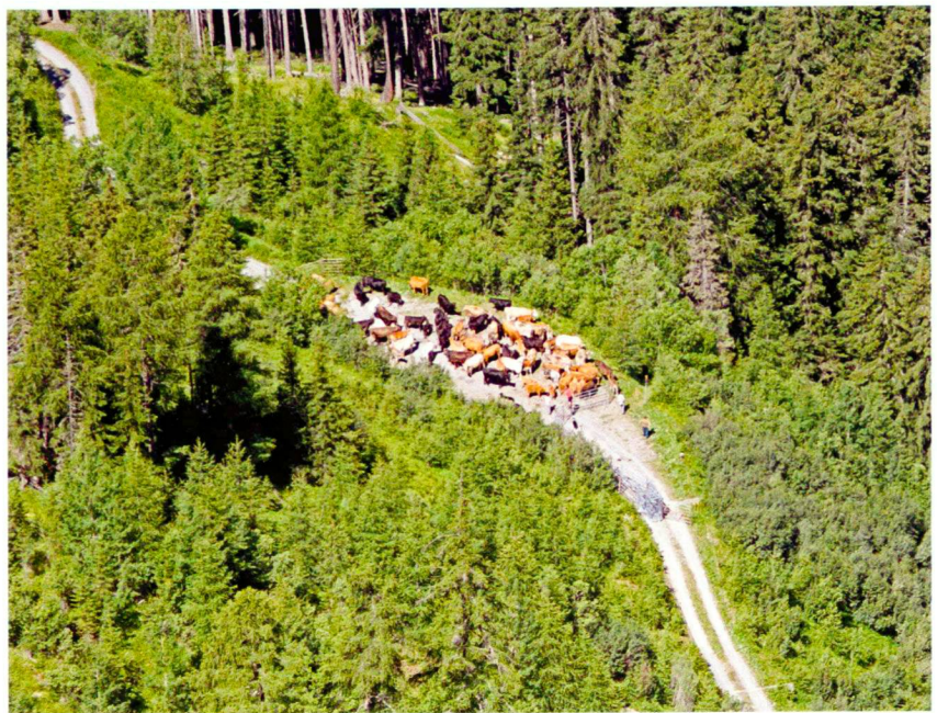
Ulrich Wasem (2)

Die wichtigste Herausforderung für die Planung und die Umsetzung von Naturschutzmassnahmen besteht darin, dass an dem lange verfolgten Konzept der Repräsentation von Biodiversitätselementen und -mustern an einem bestimmten Ort nicht festgehalten werden kann. Solche adaptiven Naturschutzkonzepte müssen die Anpassung der Natur an die Folgen des Klimawandels grenzübergreifend unterstützen. Entsprechend wichtig ist es daher, die flächenschutzrelevanten Politiken wie Planung und Zonierung, Verkehr oder Energie auch unter dem Gesichtspunkt des Klimawandels zu beleuchten und bei anstehenden Gesetzesrevisionen diesen Aspekten ein besonderes Augenmerk zu schenken. Eine erste Gelegenheit dazu ergibt sich im in Revision begriffenen Raumplanungsgesetz, welches noch dieses Jahr in die Vernehmlassung geht.