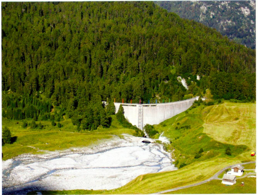
A. Seippel (5)

Unter beengten Verhältnissen entlang der Laufstrecke können vor allem Retentionsmassnahmen in Form von Hochwasserrückhaltebecken zum Zug kommen. Diese Räume in die Landschaft einzugliedern, ist angesichts ihrer Volumen – wir reden von einigen hunderttausend bis mehreren Millionen Kubikmetern – eine gestalterische Herausforderung. Heute stossen solche Vorhaben häufig auf Widerstand, wenn die Dämme nicht versteckt oder kaschiert werden können. Hier gilt es, in Zukunft auch grossräumige und volumenaufwän-