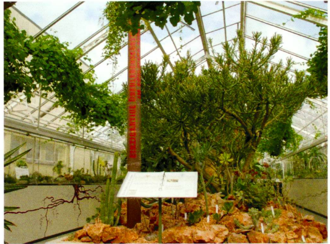
Botanischer Garten Zürich (2)