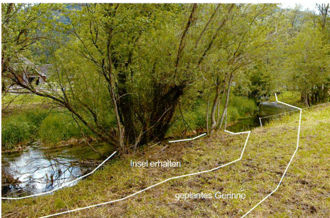
3 Detailfragen wurden mit der ökologischen Baubetreuung vor Ort abgestimmt. Aufweitung und Gestaltung des bestehenden Lauenbaches am Dammfuss. Les détails ont été discutés sur place avec la direction des travaux. Elargissement et aménagement du ruisseau Lauenbach au pied de la digue. Revital

L'exemple de la digue de Stranig illustre de quelle manière une bonne coopération entre les techniciens, les architectes-paysagistes et la population locale peut parvenir à intégrer dans le paysage des ouvrages techniques fussent-ils imposants.