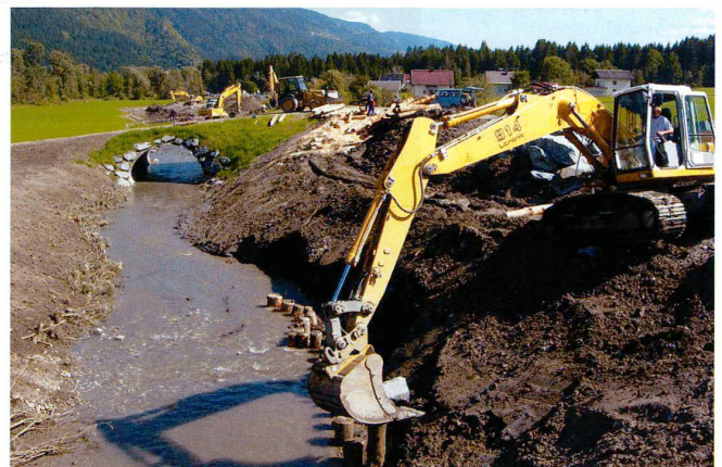
4 Mit Holzpiloten und ingenieurbioologischen Bauweisen wurde an der Dammaussenseite wieder ein strukturreiches Fließgewässer hergestellt. Par le biais du génie biologique et des pilotis en bois, un ruisseau riche en structures a pu être recréé.