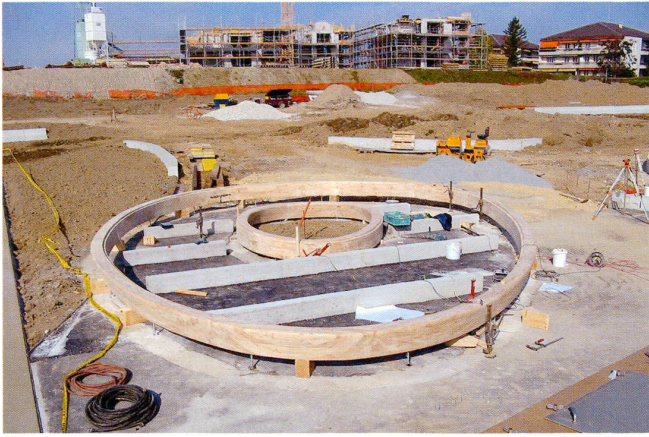
3 Lambelet Charpente [2]