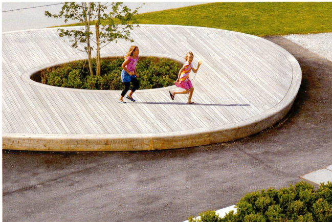
6 Léonore Baud [2]