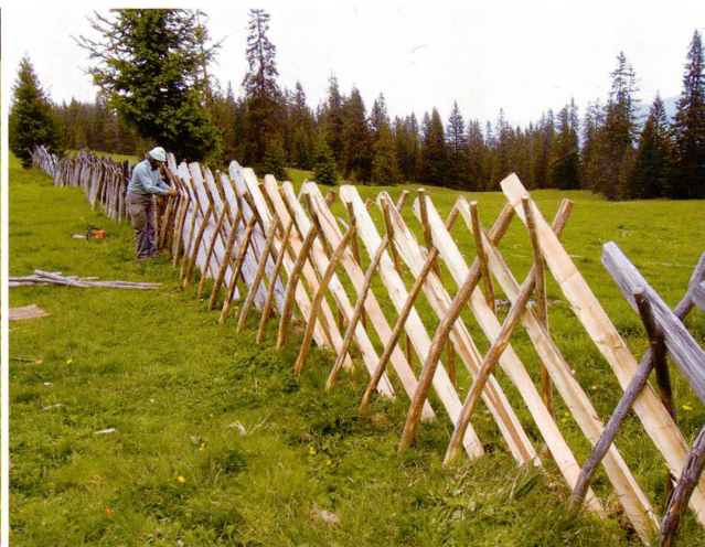
Andreas Bosshard (5) 2