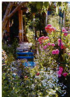
1 Ute und Martin Studer (alle)

1–15 Gartenimpressionen 2007–2009. Ambiances, 2007 à 2009.