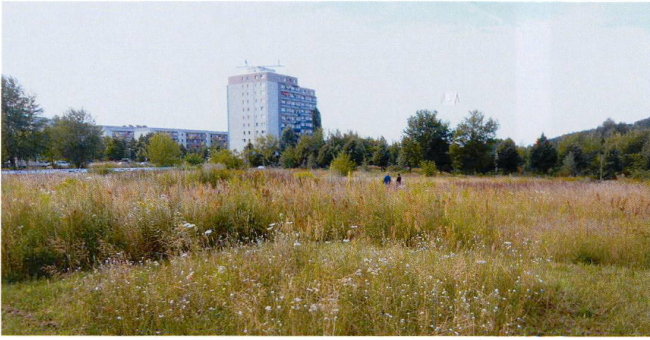
3 von der Lippe (3)